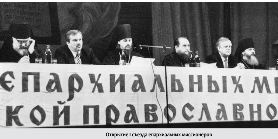
Открытие I съезда епархиальных миссионеров

Впервые за период с 1917 года было возобновлено проведение съездов епархиальных миссионеров Русской Православной Церкви.