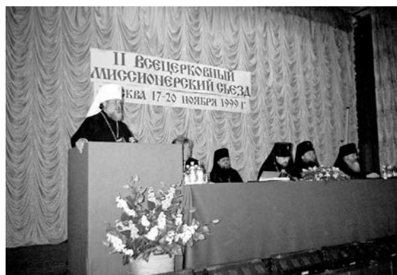
Во время работы II съезда епархиальных миссионеров

Съезд поручил Миссионерскому отделу Московского Патриархата разработать но-