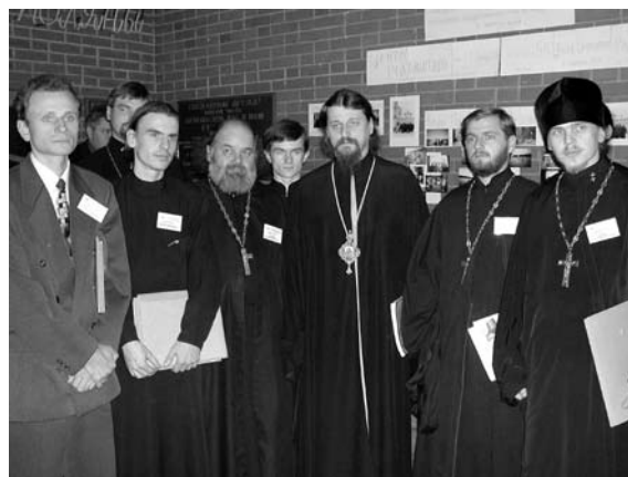
Среди делегатов III съезда епархиальных миссионеров

Работа съезда проходила на пленарных заседаниях и в 5 секциях: «Православная миссия вчера, сегодня, завтра (методы и принципы)»; «Миссия, прозелитизм, рели-