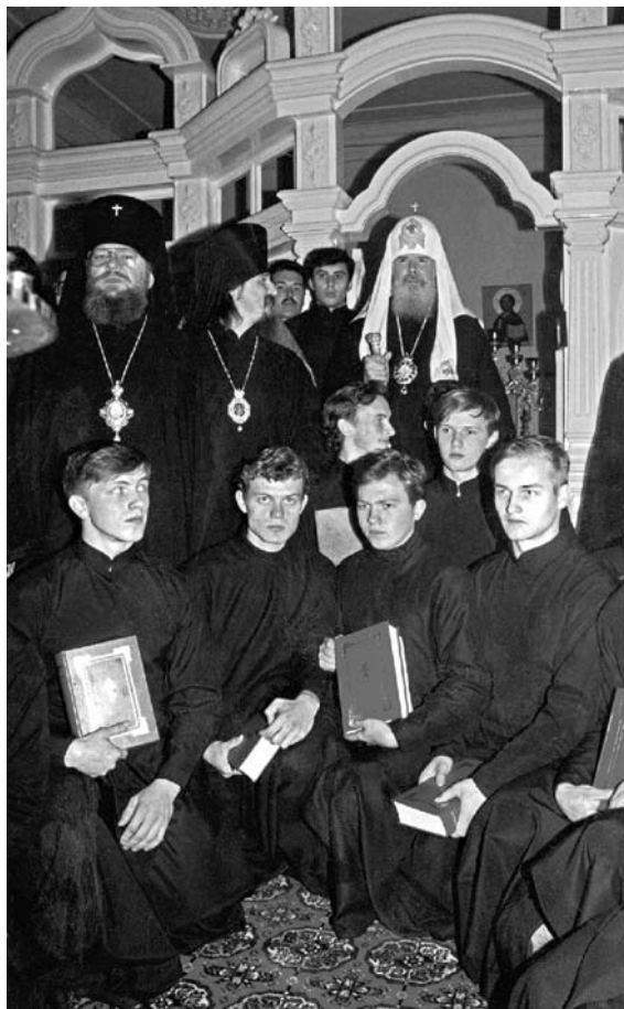
Открытие Духовной семинарии с миссионерской направленностью

В рамках выполнения Программы возрождения Миссии Русской Православной Церкви на ее канонической территории