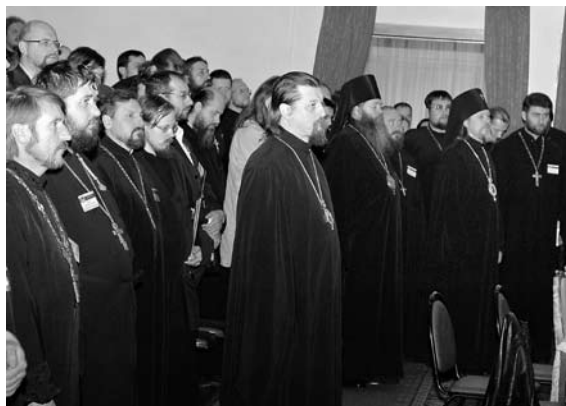
На IV съезде епархиальных миссионеров

За последние годы миссионерское поле значительно расширилось в связи с исполь-